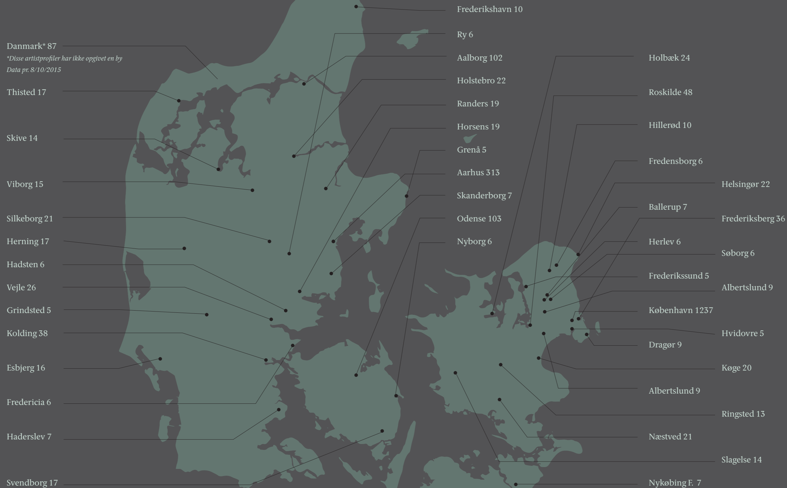
Geografisk spredning for artistprofiler på dr.dk/kanon